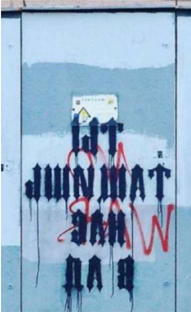
გრაფიტი მოსკოვში, შესრულებული ხელოვანის მიერ სახელად Zoom.