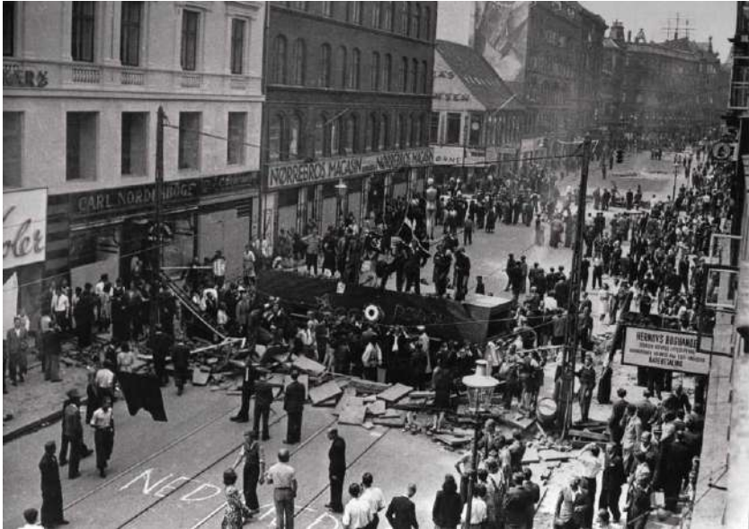
სახალხო გაფიცვა კოპენჰაგენში, 1942 წელი

დანიაში მეორე მსოფლიო ომის დროს, თავისუფლების საბჭომ, რომელიც კოორდინაციას უწევდა წინააღმდეგობის მოძრაობას, მოამზადა შიდა ანგარიში, სადაც ნათქვამია, რომ გაფიცვები უფრო მეტად აზარალებდა გერმანიის ომისუნარიანობას, ვიდრე აჯანყებები და საბოტაჟი. ეს შეფასება დაიწერა 1944 წლის ცნობილი მოვლენის - „სახალხო გაფიცვის“ მერე, როცა წინააღმდეგობის მოძრაობა საბოტაჟის მეთოდს წლების განმავლობაში იყენებდა. 20 თუმცა, ეს შეფასება თითქმის არაა ცნობილი დანიაში, სადაც გმირული საბოტაჟის შესახებ ნარატივი კვლავ დომინანტურია. 21