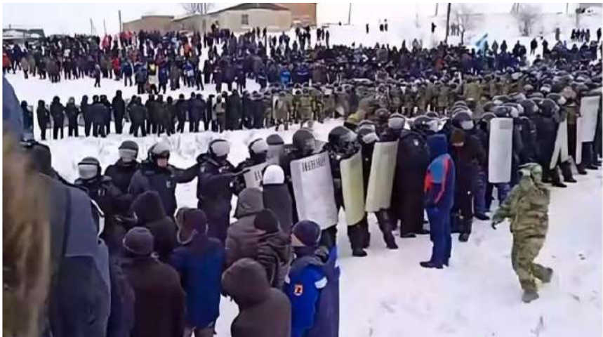
მომიტინგები და პოლიცია ბაიმაკში, რუსეთი. 2024 წლის იანვარი.

მაიკენი: კი ბატონო, მოდი, დასაწყისში ეს განვიხილოთ.