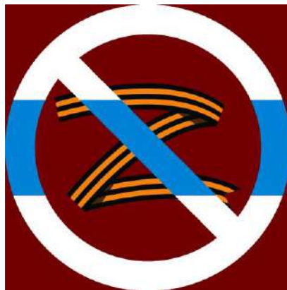
უკრაინაში პუტინის შეჭრის პროტესტის სიმბოლო

დასრულდეს? ათწლეულების მანძილზე ომს არ ვუყურებთ? უკრაინამ, ნატოს მხარდაჭერით, რუსეთის ჯარები რომ განდევნოს მისი ტერიტორიიდან, დადაბულობა დარჩება განჭვრეტადი მომავლის პერიოდში. დაბალი ინტენსივობის შეტაკებები დიდი ალბათობით გაგრძელდება საზღვრისპირა რეგიონებში, როგორც ეს ხდებოდა რუსეთის სრულმასშტაბიან თავდასხმამდე. როდის უნდა იგრძნონ მშვიდობა უკრაინელებმა? მგონი, საჭიროა ვიფიქროთ, ვის შეუძლია პუტინის მმართველობიდან მოცილება და რუსეთის მოსახლეობის დამოკიდებულების შეცვლა იმის მიმართ, რაც ხდება უკრაინაში. ამ ეტაპზე, რუსეთში ავტორიტარული ძალები არიან გაძლიერებული და რაც უფრო დიდხანს გაგრძელდება ომი, მით უფრო გაძლიერდება მტრობა რუსეთსა და უკრაინას შორის და გაგრძელდება ათწლეულების მანძილზე.