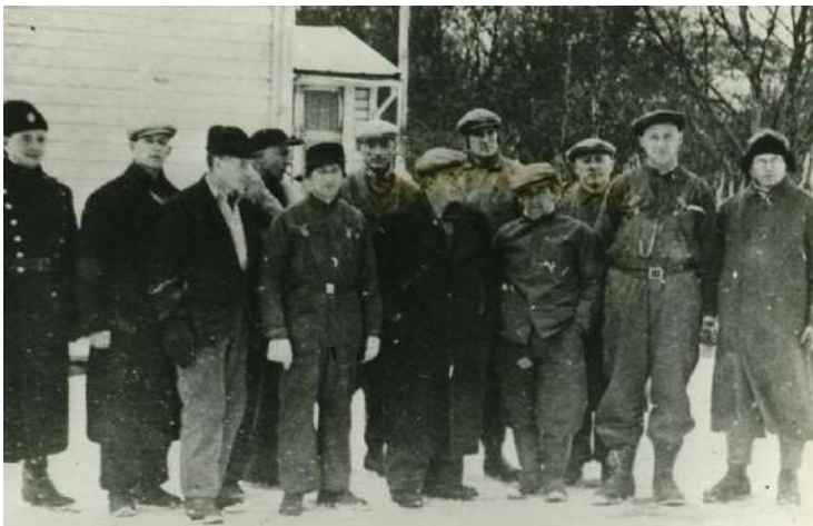
მასწავლებლები კირკენის ციხის ბანაკში, ნორვეგია 1942 წელი.

ამ დრომდე ნორვეგიის ნაცისტური ადმინისტრაცია მართავდა სიტუაციას, მაგრამ წინააღმდეგობიდან და სკოლების დახურვიდან ერთი თვის შემდეგ, გერმანიის საოკუპაციო ადმინისტრაცია ჩაერთო სიტუაციაში. მათ დავალება მისცეს პოლიციას, დაეპატიმრებინა 1 100 მამაკაცი მასწავლებელი, რაც აღსრულდა მთელი ქვეყნის მასშტაბით. აქ ვინმე იკითხავს - ნორვეგიის პოლიცია რატომ ემორჩილებოდა ნაცისტების ბრძანებას და რა მოხდებოდა თუ ისინი უარს იტყოდნენ მათთან თანამშრომლობაზე და მასწავლებლების დაპატიმრებაზე?.. მაგრამ ეს სხვა ისტორიაა. 1 100 მასწავლებელი დააპატიმრეს და ეტაპობრივად, დაახლოებით ნახევარი გაგზავნეს მძიმე სამუშაოებზე ჩრდილოეთ ნორვეგიაში. გზაში აწამებდნენ და აძლევდნენ არაადეკვატურ საჭმელს და თავშესაფარს. ამ ვითარებიდან გამომდინარე, ზოგიერთმა მასწავლებელმა მართლაც გააუქმა ხელმოწერა დეკლარაციაზე, მაგრამ უმრავლესობა არ თმობდა პოზიციას. ნელ-ნელა ნაცისტებს მოუწიათ დამარცხების აღიარება და გახსნეს სკოლები. ფურცელზე, მასწავლებლები იყვნენ NL-ის წევრები, მაგრამ მათ არ სთხოვდნენ ნაცისტური პარტიის წევრობას და არცერთ მასწავლებელს არ ჰქონდა ვალდებულება, რამე ახალი მოვალეობა შეესრულებინა ამ წევრობის გამო.